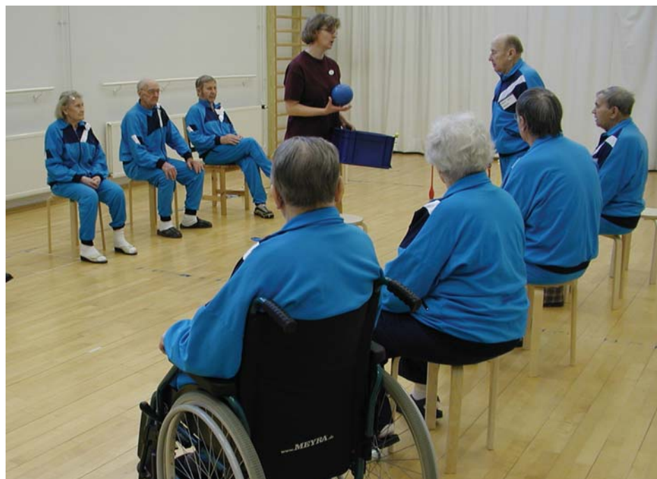
Kuvassa Kitinkannuksen asiakkaita

Broschyren "Ändringsarbeten i bostaden" beskriver de