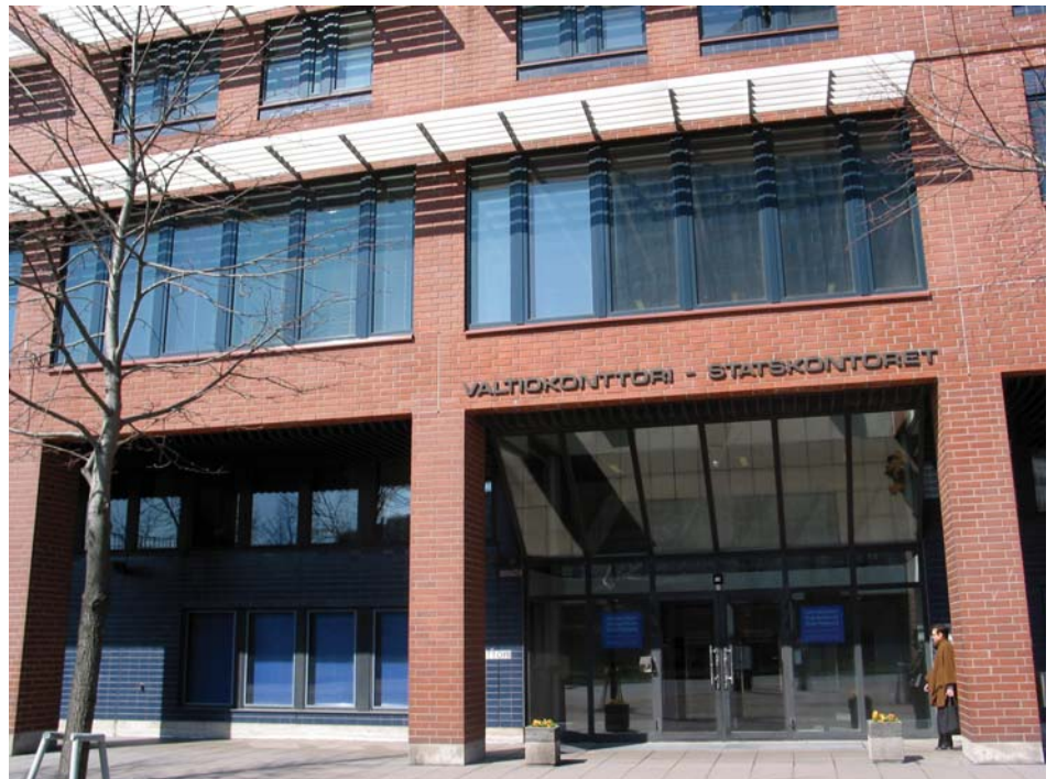
Valtiokonttorin Vakuutustoimiala, Sotilasvamma- ja veteraanasiat. Uusi käyntiosoite on Sörnäisten rantatie 13.

Muutto voi aiheuttaa jonkin verran viivästyksiä ja ruuhkaa hakemusten käsittelyyn, joten Valtiokonttorista toivotaan ymmärrystä ja kärsivällisyyttä.